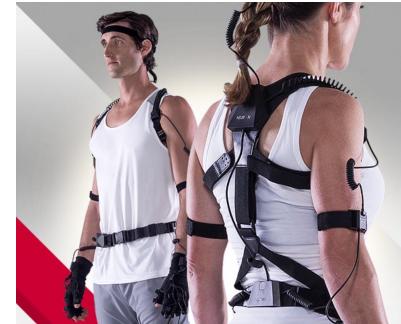
装着式モーションキャプチャ