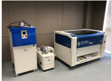
レーザーカッター

優れたコストパフォーマンス。 ロボット製作の新たなスタンダード。 価格: 200,000円(税別) 価格: 120,000円(税別)