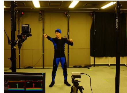
光学マーカ式モーションキャプチャ