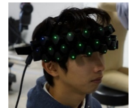
装着式脳活動計測装置