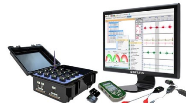
ワイヤレス筋電位信号計測装置