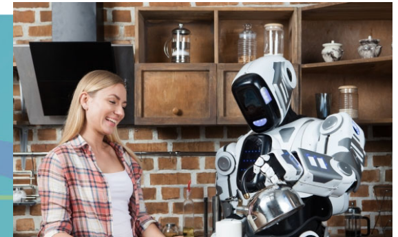
将来はロボット と家族団らん