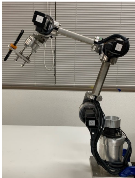
4軸垂直多関節マニピュレータ