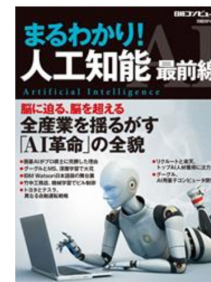
日経コンピュータ執筆

人の 行動 を世界規模で 認識 する、IoT技術 未来の 医療・介護 を解決する、ビッグデータ技術 社会を変えるAIを、君に。