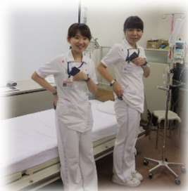
スマホなどのセンサ