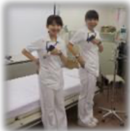
スマホなどのセンサ