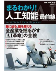
日経コンピュータ執筆

人の 行動 を世界規模で 認識 する、IoT技術 未来の 医療・介護 を解決する、ビッグデータ技術 社会を変えるAIを、君に。